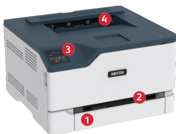
Drukarka kolorowa Xerox® C230