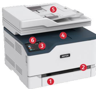
Kolorowa drukarka wielofunkcyjna Xerox® C235